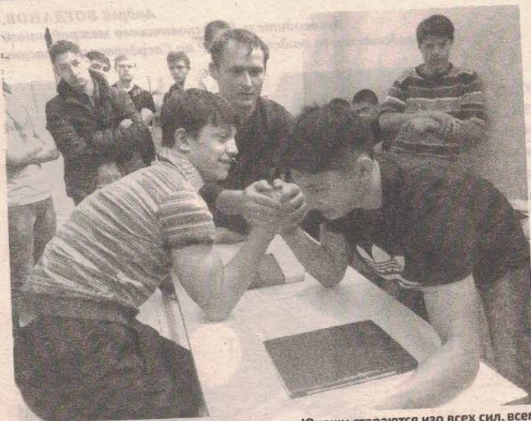
Один из видов соревнований - армрестлинг. Юноши стараются изо всех сил, всем хочется только победы.

По итогам соревнований первое место заняла команда Тыгишской школы, второе место – команда школы села Коменки, третье место – команда школы №2. Победители были награждены Почётными грамотами и призовыми кубками. Также Почётными грамотами были награждены преподаватели ОБЖ школ, организовавшие это мероприятие и подготовившие свои команды к соревнованиям.